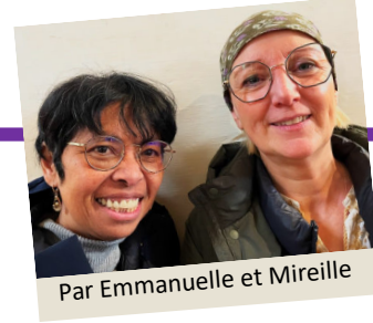
Par Emmanuelle et Mireille